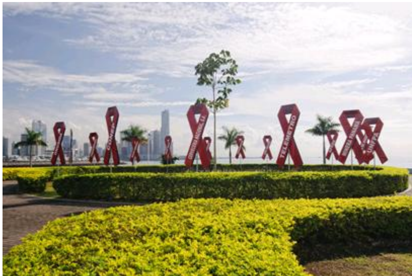
Kuva. UNAIDS: World Aids Day in Panama City

Lähde: Hiv- ja aids-tilastot. THL. Saatavilla osoitteessa: www3.thl.fi/stat/